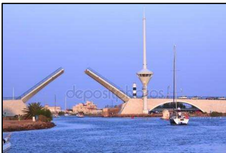
Unikátní padací most v San Javieru.