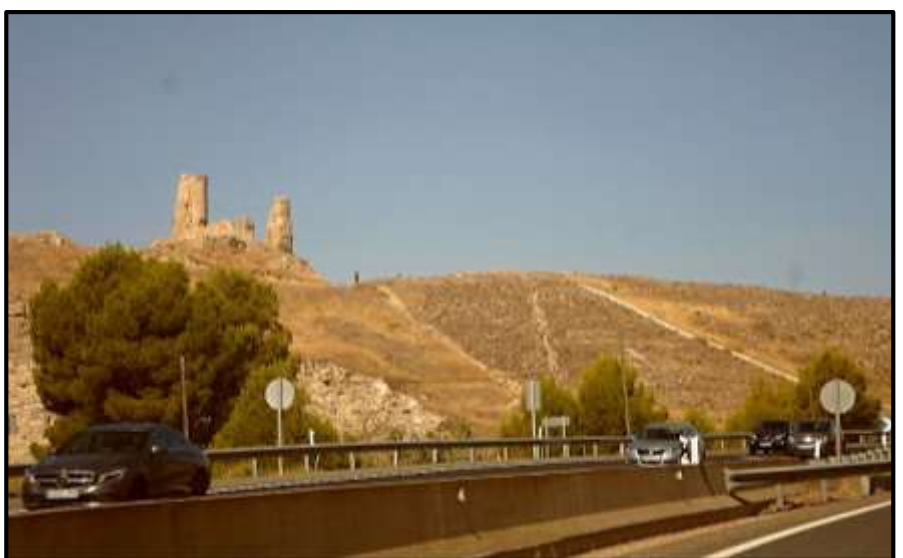
Asi španělské TROSKY...