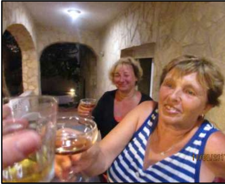
Na zdraví naší expedice...