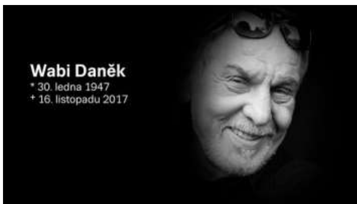
Vzpomínali jsme na Wabiho.