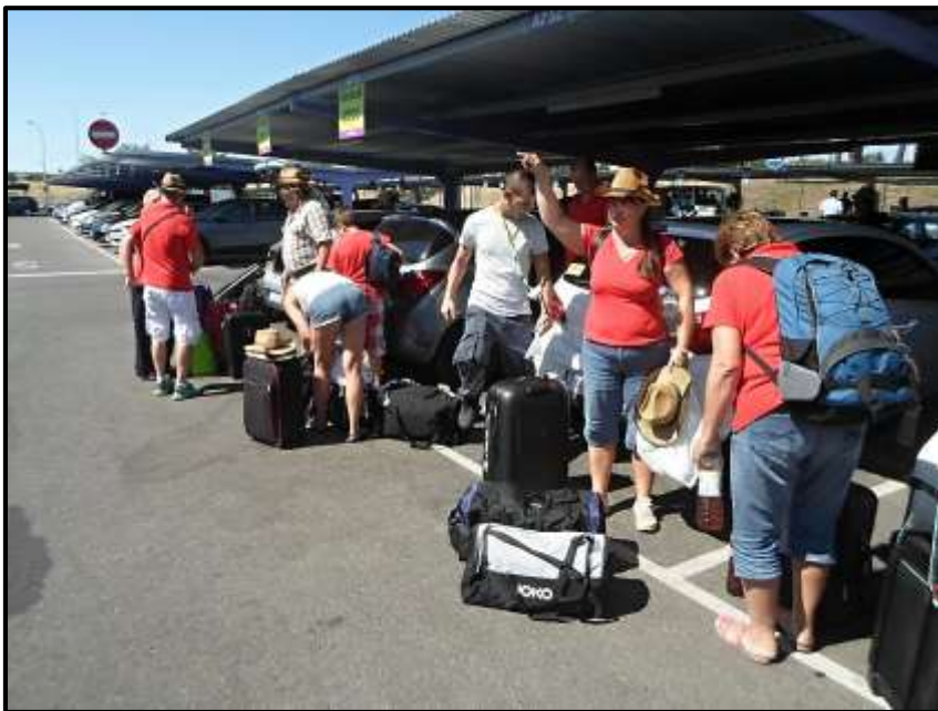
Vrácení našich aut půjčovně.