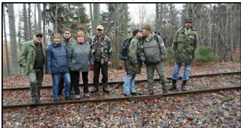
Před vechtrem SEVERKY.