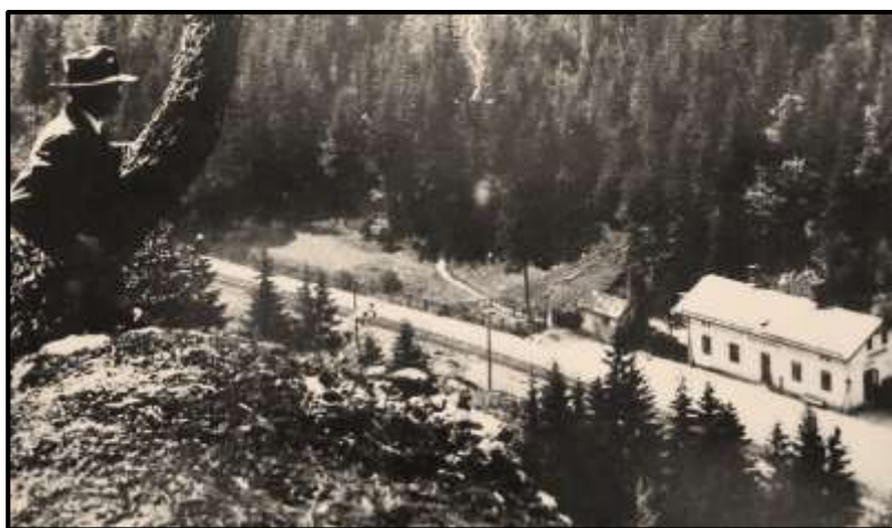
Dobové foto nádraží v Návarově.