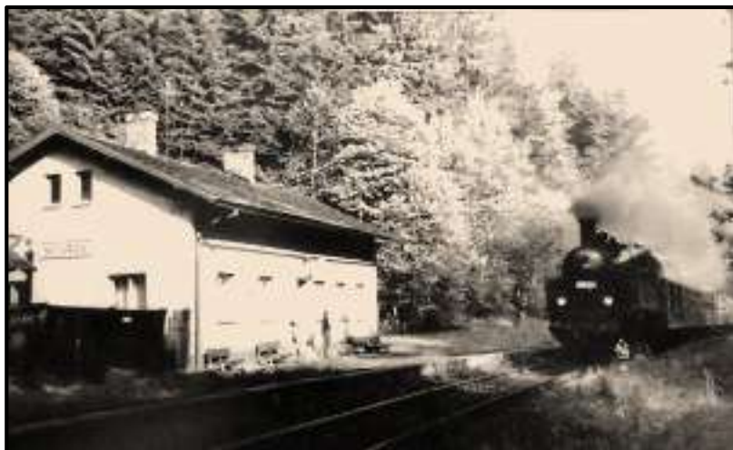
Ještě v 70. letech jsme jezdili na Návarov párou...

„Jiné kafe“ je NÁVAROV. Budí ve vás sílu, výdrž a odhodlání i pocit, že nakonec se vše k dobrému obrátí. Možná, že i proto přetrvala do dnešních dnů pověst o Ludmile, dceři majitele Frýdlantského panství, která se odmítla vdát za muže, jež jí vybral otec, a raději pobrala pár svých šperků a se svým milým panošem Jindřichem uprchla. Otec zuřil a všude je nechal hledat, jenže jakoby se po nich země propadla. I začal se domnívat, že spolu z tohoto světa smrti sešli. Po mnoha letech vydal se na projížďku do lesů, kde jej zastihla noc. Lesy byly plné vlků, a tak raději na mohutném dubu na okraji rokle přespal. Ráno uviděl stoupat z rokle dým. Slezl dolů a spatřil malý, chudý a zanedbaný hrad a v něm ženu s děckem v náručí. Pozvala jej dál a pohostila navařeným hrachem. Pak se z lesů vrátil s úlovkem její muž. I poznal v nich svou dceru a panoše Jindřicha. Jindřicha nejprve chtěl mečem proklát, ale pak se usmířili a nakonec byl rád, že je našel a že je dědečkem. Ještě i peníze na rozšíření panství poskytl. Prostě Návarov umí překvapit. (Kdysi jsem si z vandru na