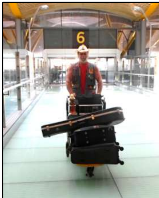
Rozloučení se Španělskem.