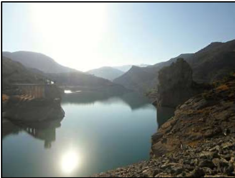
Jezero v Sierra Nevada.