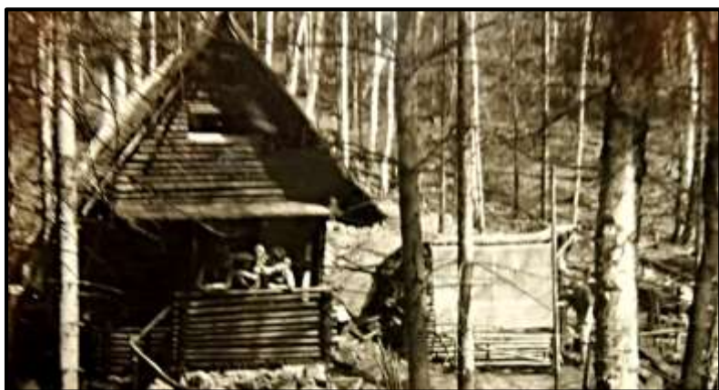
První SEVERKA kdysi a dnes...

Posledním místem, které jsme navštívili, byla osada KLONDAJK. Pokecali jsme s Fousem a pak pomalu došli na WHITE STAR, kde jsme pokecali u malého pomníčku a zapálili svíčky. Večer jsme pak opět poseděli v boudě a zahráli i něco málo snědli a vypili.