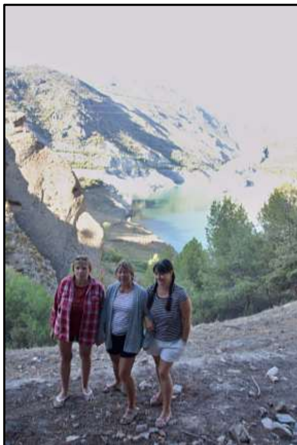
V Sierra Nevada.