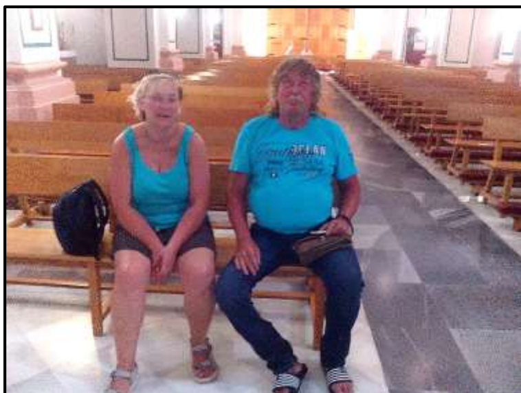
Ďábel vzal svou družinu do kostela...