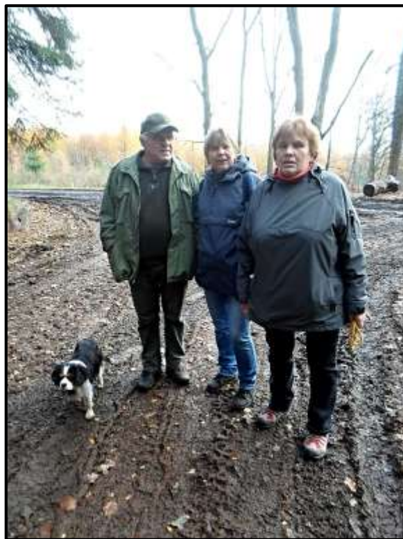
TO. SEVERNÍ HVĚZDA.