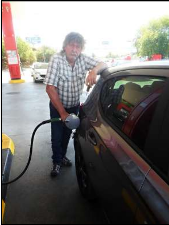
Poslední tankování ve Španělsku.