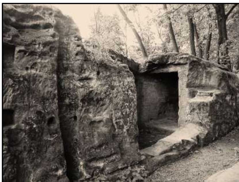
Skalní světničky Valečova ve kterých jsme hlavně v 70. letech něco naspali...

Krásná krajina Českého Ráje začala být opětovně tzv. „v kurzu“ v období po Mnichovské dohodě. Pohraničí, a s ním samozřejmě i lesy, hory, skály, bylo od republiky násilně oderváno. Nechci se nikterak vyjadřovat k tehdejší době, jen bych ráda upozornila na to, že přes všechnu tu hrůzu (anebo možná právě proto) se stejně jelo na výlety,