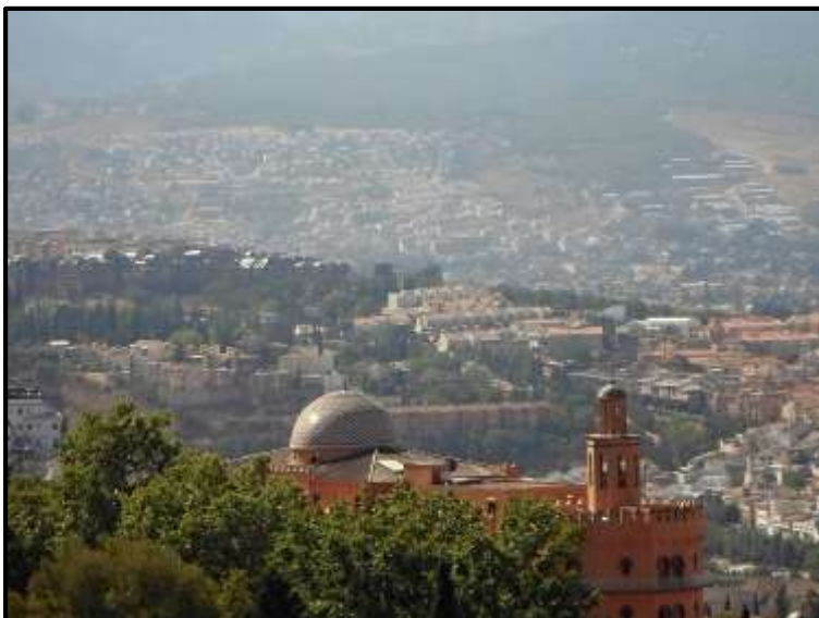
Pohled z Rudého hradu na Granadu.