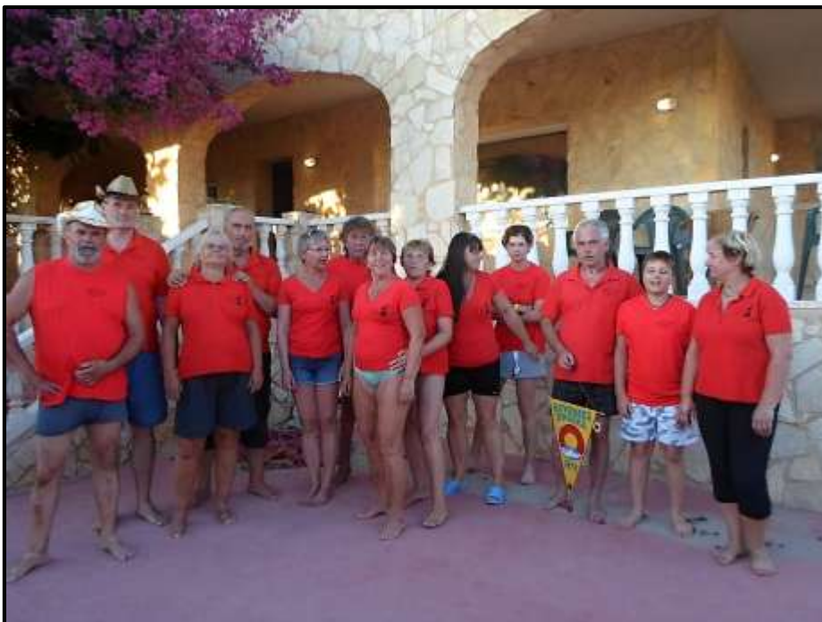
Členové EXPEDICE OLD PIRINEOS 2017

Dnes jsme naposledy sledovali východ slunce nad mořem, opět nádhera. Moře je stále neskutečně rozvlněné, a tak jsme opět ranní koupání raději vynechali. Po snídani jsme vyrazili jen na lov mušliček, abychom měli nějakou památku nejen na naší haciendu, ale i na chvíle zde prožité!