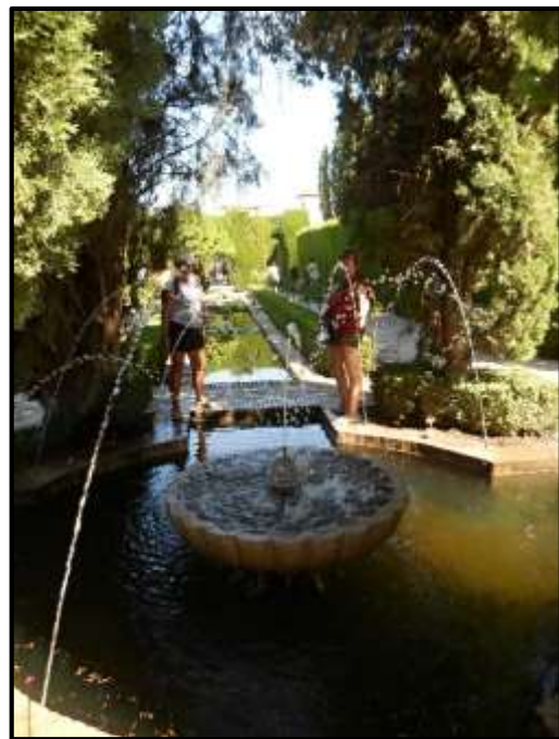
Vodní zahrady Alhambry.

Cesta domů vedla přes neobydlenou prérii, která se pak změnila v silně osídlené části. Samozřejmě jsme se blížili k moři na haciendu. Doma jsme se dozvěděli, že bohužel Kantor trochu škrábnul auto, tak to budeme řešit až v Madridu. Adios.