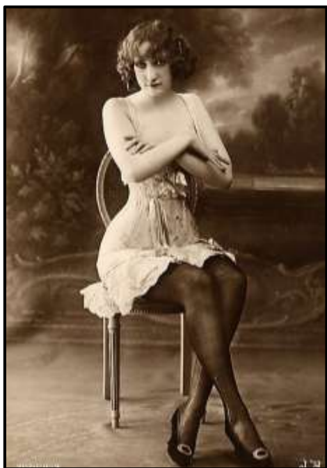
2x ilustrační fotografie.

Kvůli zoufalství, utrpení a velmi málo jiných zaměstnání pro ženy Starý západ nadělal z mnoha žen prostitutky. Ke konci 18. století odešlo mnoho prostitutek z Francie pracovat do hornických campů západu USA. Tyto ženy byly ve věku 18 – 24 let. Prostitutky Starého západu se skládaly ze všech ras a etnik. Některé byly vdané a jiné ne. Mnoho těchto žen mělo jen přezdívky. Všechny měly ale něco společného, zdá se, že jejich jediná cesta životem vedla světem prostituce.