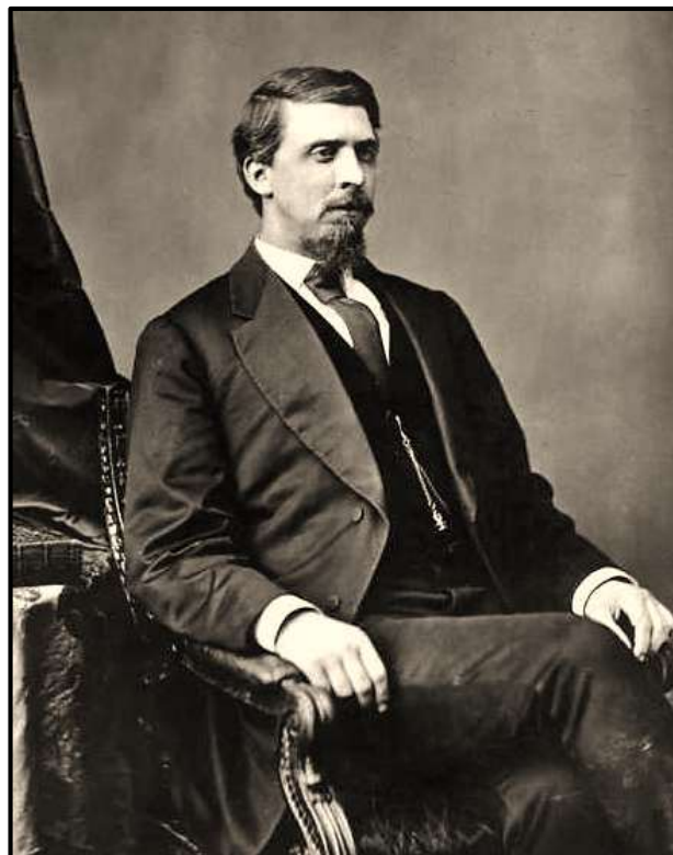
Foto - soudce Issac Parker.

Přísný a schopný federální soudce Issac Parker dostal zanedlouho přezdívku „věšící soudce“, protože poslal velmi mnoho lidí na šibenici. Parker se proti kritikům četných poprav hájil takto: „ Pokud chce někdo kritizovat, ať kritizuje systém a ne muže, co mu slouží! “ Během 21 let na soudní stoličce ve Fort Smithu, soudce Parker odsoudil 160 mužů k smrti a 79 z nich bylo oběšeno. 10. května 1875, jenom osm dnů po příjezdu do Fort Smithu, otevřel svůj první soudní proces. Osmnáct osob bylo už před tím obviněno z vraždy a patnáct jich bylo usvědčeno. Osm z nich potom odsoudil k smrti na šibenici 3. září 1875. Jeden muž byl zabit při pokusu o útěk a druhý byl odsouzen k doživotnímu vězení, kvůli svému mládí.