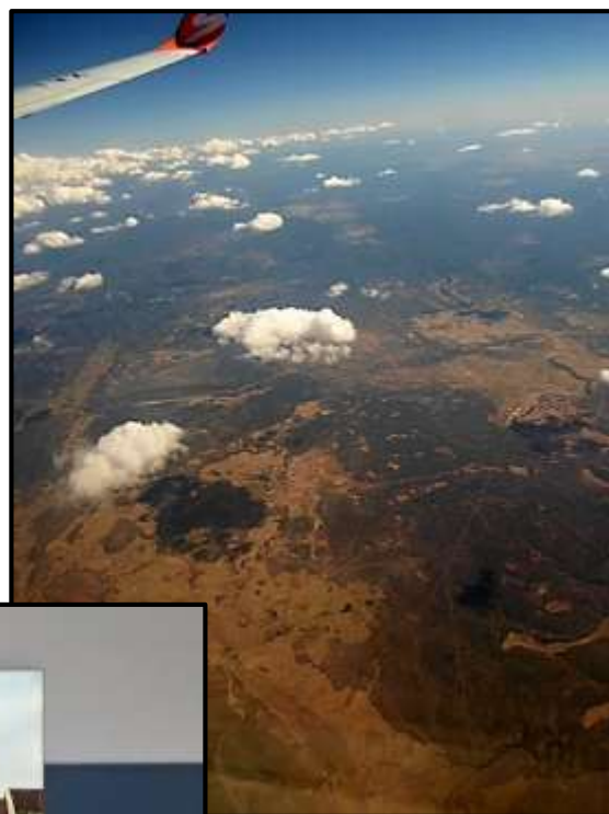
A jsme doma!

FOTKY NAJDEŠ NA: toh.rajce.net nebo http://kantor-ch.rajce.idnes.cz/