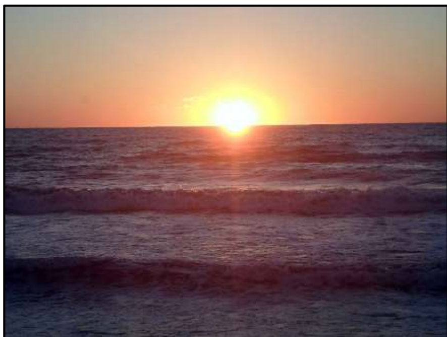
Začíná další den.

Dnes ráno jsme konečně /někteří/ viděli východ slunce bez mraků, ale za větru a velkých vln, které nám bily o ohradu haciendy a sebraly velký kus pláže. Vedle naší haciendy i navršily velké množství trav a v písku jsme provedli sběr různých mušliček. Hned po snídani někteří odvážlivci šli do vln, ale ne nadlouho, přeci jenom