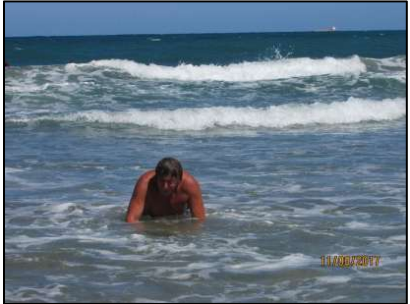
Koupání ve vlnách byl docela adrenalin.