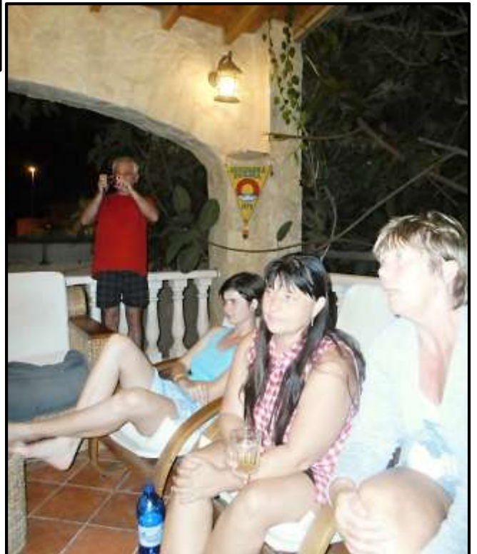
Osadní večer na haciendě.