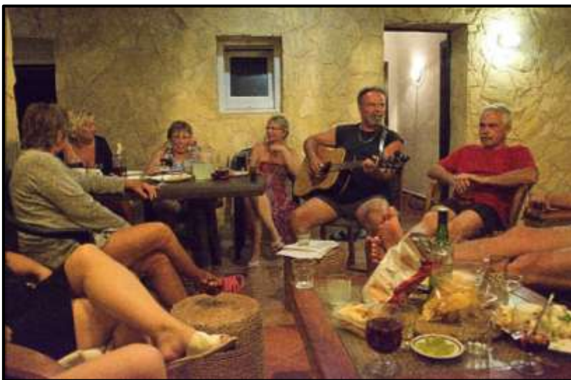
Závěrečná slezina na západní terase.

než nám holky povolily požívat tekuté potraviny, nahnaly nás na taneční parket, abychom potrénovali labutě! Opět plno smíchu, ale už jsme zabaletili celou choreografii. Zuzanka byla spokojena, i když labuť Rys by neustále něco měnila, nedali jsme se!!!