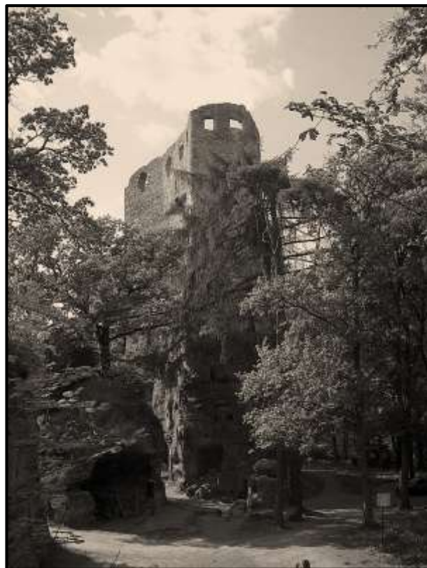
Hrad Valečov. Kdysi ráj trampů. Dnes má i průvodce, ale je nějaký divnej!