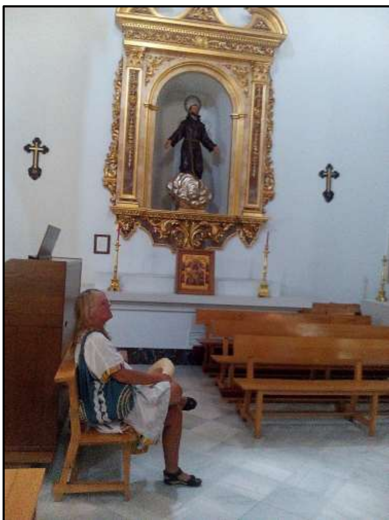
Kostel v San Javier