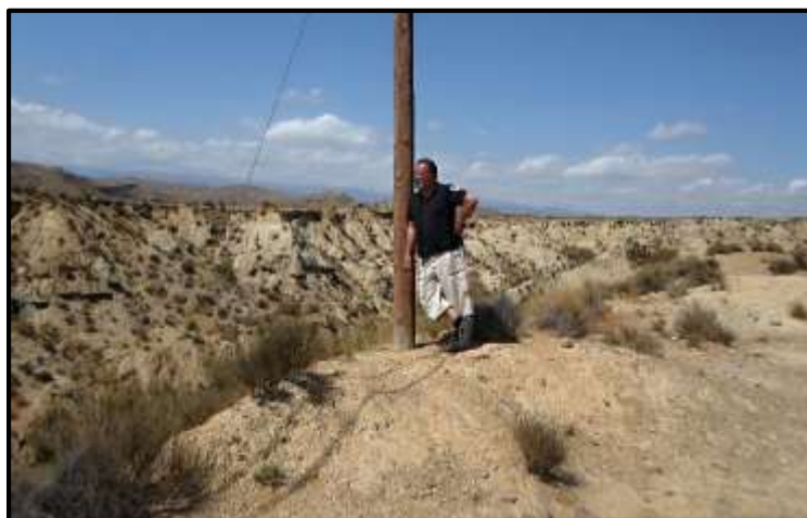
V poušti před FORT BRAVEM.