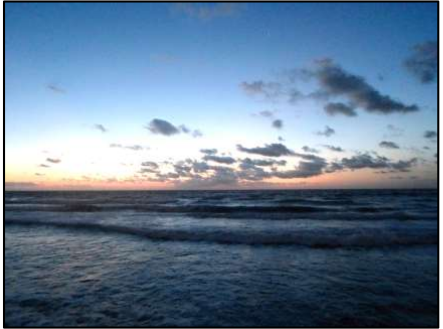
Začíná svítat a my vyrážíme na dlouhou cestu do Madridu.